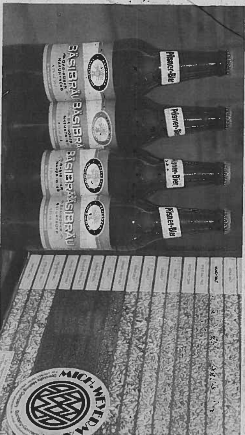
Getragter Durstlöcher: Das Bäsibräu-Bier hat einen guten Ruf, von der Jahresproduktion bleibt jeweils keine Flasche übrig.